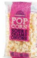
31071 POPHOUSE POPCORN SOUR CREAM & ONION 65 g