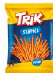
56677 TRIK SUOLATIKKUJA 90 g