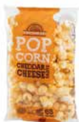
31029 POPHOUSE POPCORN CHEDDAR 65 g