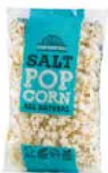
31018 POPHOUSE POPCORN SALT 50 g