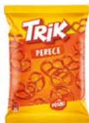
56675 TRIK PRETZELS SUOLAKEKSEJÄ 95 g