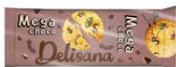
322697 DELISANA CRUNCHY SUKLAA 100 g