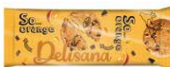
322700 DELISANA CRUNCHY SUKLAA-APPELSIINI 100 g