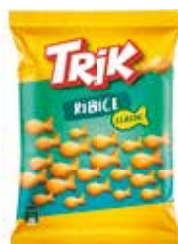
56676 TRIK SUOLAKALAT 90 g